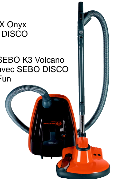
SEBO K3 Volcano avec SEBO DISCO Fun