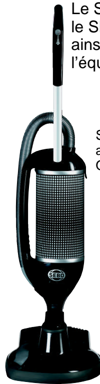
SEBO FÉLIX Onyx avec SEBO DISCO Onyx

Le SEBO DISCO peut être utilisé avec le SEBO FÉLIX, SEBO K3, SEBO C3 ainsi qu'un aspirateur central en l'équipant d'un adaptateur.